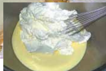
Geschlagenes Obers unterheben